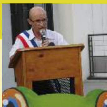
La soirée sans voiture en images