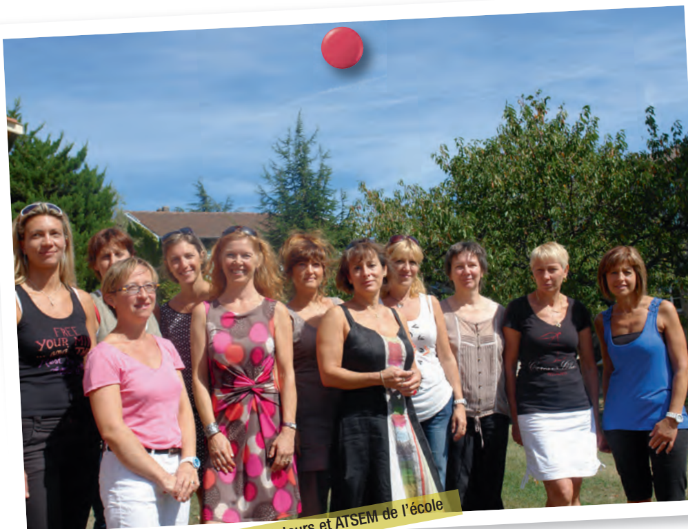
Instituteurs et ATEM de l'école maternelle des Chadrillons