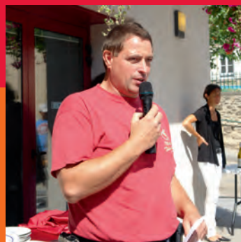
Fête de la pêche de vigne