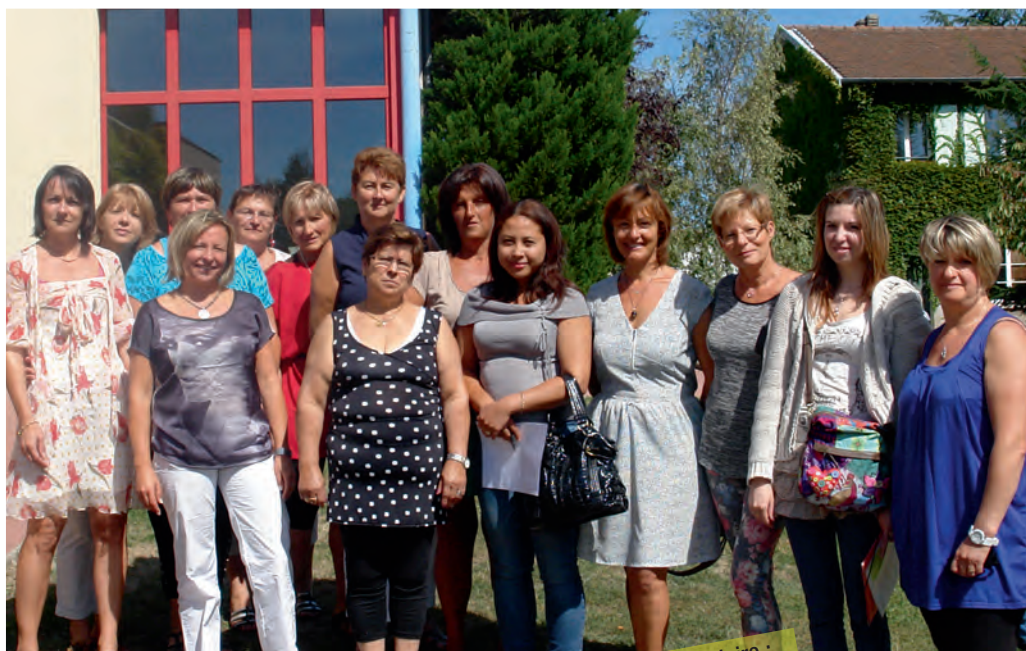
L'équipe périscolaire : restaurant, loisirs, garderie