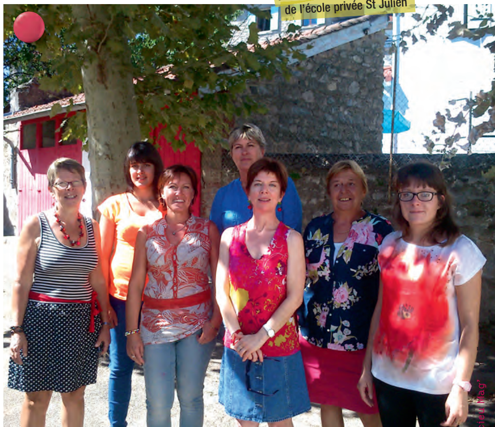
L'équipe enseignante de l'école privée St Julien